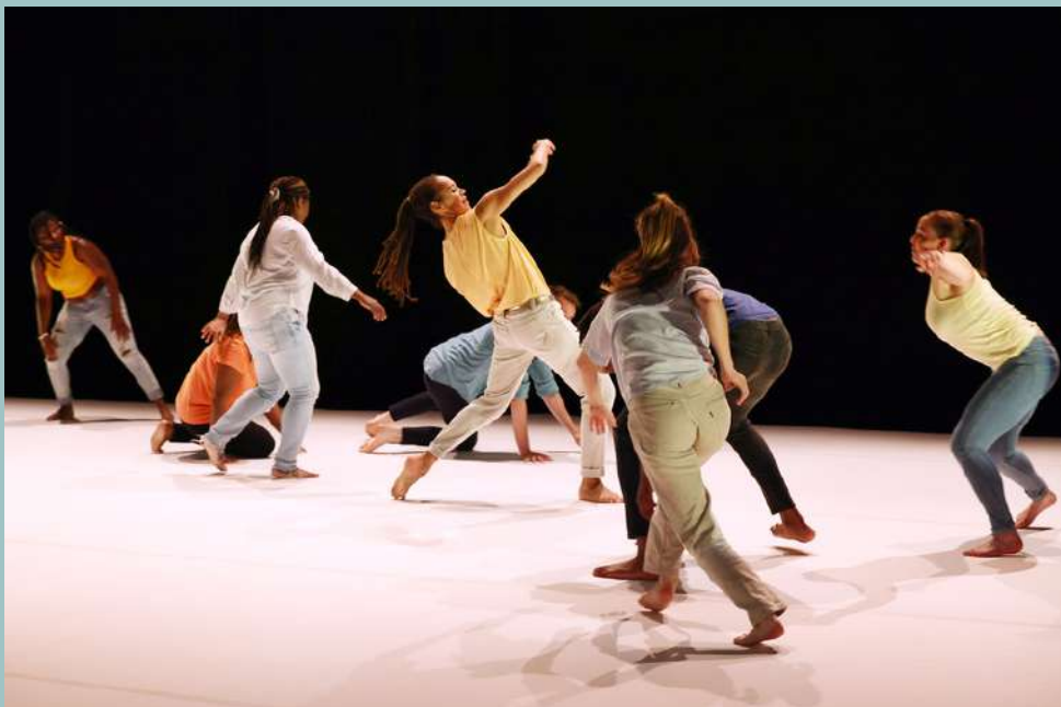
Représentation d' Ici et Là à l'Atelier de Paris / CDCN le 2 juin 2023

Des enjeux fondamentaux pour cheminer vers le redressement et les projections de soi, vers l'Autre.