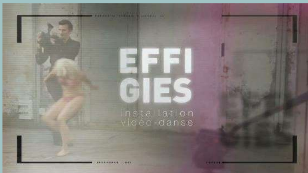
Effigies - compagnie Point Virgule