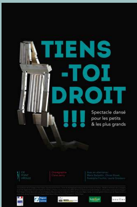
Tiens toi droit !!! - compagnie Point Virgule

Coproduction du Prisme - Centre de développement artistique de Saint-Quentin-en-Yvelines - Résidence territoriale de la compagnie au sein de l'Agglomération de Saint-Quentin-en-Yvelines (78), Le Prisme a reçu le soutien de la DRAC IDF pour la résidence territoriale d'artistes en milieu scolaire menée par la Compagnie Point Virgule à l'école élémentaire Jean de la Fontaine à Élancourt (78). Avec le soutien de la DRAC Centre, de la Région Centre, du Conseil général d'Eure-et-Loir (28), de l'Espace Soutine à Lèves (28), de la ville de Franconville (95) et de l'Espace Michel Simon à Noisy-le-Grand (93).