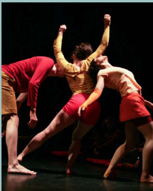
Incertain corps - compagnie Point Virgule

Coproductions Service Culturel de Champigny-sur-Marne (94), Communauté d'Agglomération du Val d'Yerres (91), villes de Yerres et de Brunoy, Le Prisme Centre de développement artistique de l'Agglomération de Saint-Quentin-en-Yvelines (78), MAC de Créteil (94). Avec les soutiens du Conseil général du Val-de-Marne (94), du Conseil général de l'Essonne (91) et de l'Atelier de Paris / CDCN (75).