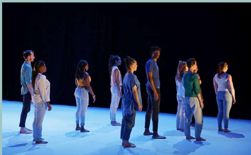
Représentation à l'Atelier de Paris / CDCN le 2 juin 2023