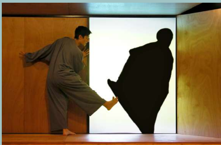
T'es qui toi ? - compagnie Point Virgule

Avec les soutiens de la DRAC Centre-Val de Loire, de la Région Centre Val-de-Loire et de la Région Ile-de-France, des Conseils départementaux de l'Essonne (91) et du Val-de-Marne (94), de la Commanderie - Mission Danse de Saint-Quentin-en-Yvelines (78), de la Ville de Tours/Label Rayon Frais création plus diffusion (37), de La Pléiade à La Riche (37), du Théâtre Jean Vilar de Vitry-sur-Seine (94), de La Lisière à Bruyères-le-Châtel (91), de la ville de Champigny-sur-Marne (94) et des Organismes Vivants (coproduction dans le cadre de l'Aide à la Permanence Artistique et Culturelle de la Région Ile-de-France).